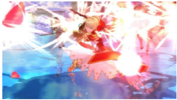
SOUL SACRIFICE DELTA (ソウル・サクリファイス デルタ) / 2014 年 (受託開発) ©2014 Sony Interactive Entertainment Inc.