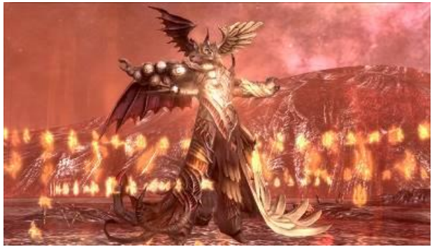
SOUL SACRIFICE (ソウル・サクリファイス) / 2013 年 (受託開発) ©2013 Sony Interactive Entertainment Inc.